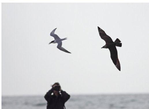
Skagen – kjo ve jager terne

I billeder følger vi et typisk forårstrækforløb fra det øjeblik, de første kragefugle, duer og lærker dukker op i marts, indtil de sidste småfuglearter som havesanger, kærsanger og karmin-dompap flyver forbi i maj/juni. På dette tidspunkt ses der også ofte en del sjældne fugle. Især rovfugle og lommer har gjort Skagen berømt som fuglelokalitet. Både antallet af arter samt totalantallet af trækkende rovfugle gør, at stedet er enestående blandt europæiske fuglelokaliteter.