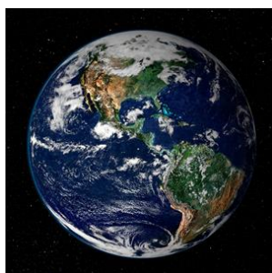
Jorden set fra rummet fra 35.000 km afstand

I foredraget vil du blive præsenteret for en ny idé: At eksportere grønlandsk mudder til troperne. Minik Rosing og hans kolleger er ved at undersøge om man samtidig kan skabe et nyt, bæredygtigt erhverv i Grønland og revitalisere de forarmede landbrugsjorde i Troperne, og dermed skabe økonomisk vækst i fattige tropiske og subtropiske områder.