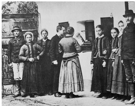
Bartók indspiller folkemusik

Bartók var både komponist, pianist og en pioner inden for folkemusikforskningen. Han forlod Europa i 1940 og tilbragte sine sidste fem år i USA. Et hovedværk fra denne periode er "Koncert for orkester" fra 1943.