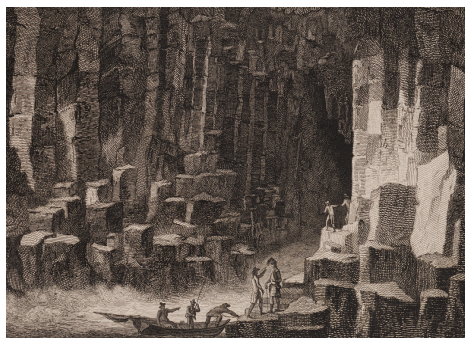
Fingal's Cave (Hebriderne) 1802

Mendelssohns rejse til Skotland i 1829 danner baggrund for symfoni nr. 3, "Den skotske", og koncertouverturen "Hebriderne", hvor en stærk naturoplevelse fornemmes. Året efter indleder han sin dannelsesrejse til Italien, inspireret af den aldrende digter Goethe. Italiensk temperament og kolorit præger symfoni nr. 4, "Den italienske".