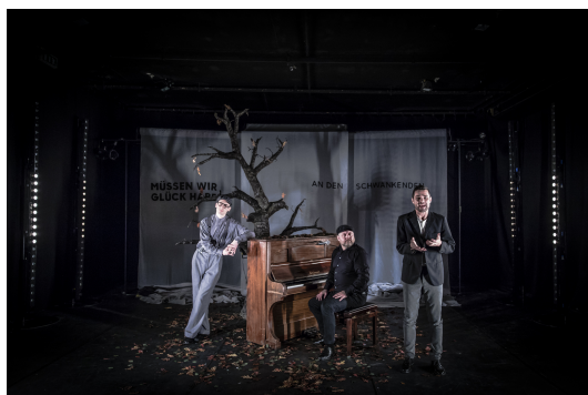
Fra forestillingen "Svendborgdigte"

Det vil også være muligt at opleve prologen indendørs fra caféen eller balkonen på første sal.