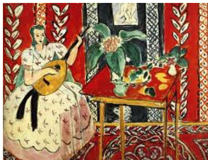
Henri Matisse: Le luth (1943)

Tidens dom over kunstneren Henri Matisse er, at hans maleri rummer en særlig skønhed og ro – og at han ikke viger tilbage for det dekorative. Hvad er faren ved det dekorative? Er det kunstens fjende? Denne undervisningsgang ser vi nærmere på Henri Matisses liv og produktion og med afsæt heri diskuterer vi det dekorative og undersøger forholdet mellem det dekorative og det feminine og mellem overflade og dybde.