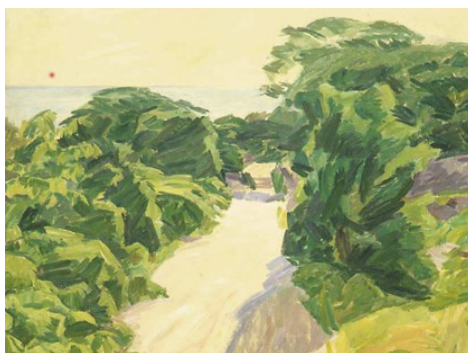
Edvard Weie: Skovvej, Christiansø