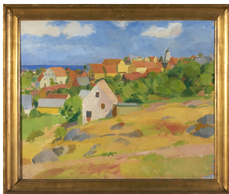
Karl Isakson: Udsigt over Gudhjem (1921)

Det samme foredrag afholdes også onsdag aften 7/3 i Sognegården (se side 22).