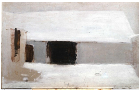
Oluf Høst: Nyfalden sne (1938)

Det samme foredrag afholdes onsdag aften 4/4 i Sognegården (se side 22).