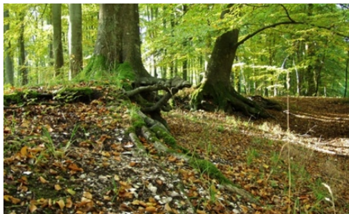
Køkkenmødding, Mejlgaard, Norddjursland

Diskussionerne – og nye synspunkter – om skiftet fra jægerfisker til bonde vil blive berørt, og til slut vil der blive givet et par eksempler på god og dårlig formidling af vor viden om ældre stenalder.