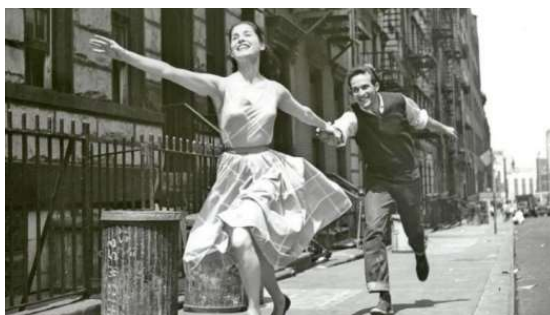
West Side Story

Med udgangspunkt i Bernsteins musical "West Side Story" tegnes et billede af et multitalent, der udfoldede sig som både komponist, pædagog og ikke mindst som dirigent. Vi lytter til orkestermusik af Bernstein og ser på højdepunkter i dirigentkarrieren, med Carl Nielsen og Espansiva in mente.