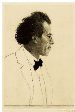
Gustav Mahler (Emil Orlik)