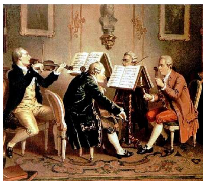
Strygekvartet sidst i 1700-tallet

Kammermusikken har mange former – men hele tiden med solistisk besætning. Her skabes et rum for intense musikalske dialoger. Musik af J.S. Bach, Haydn, Mozart og Schubert viser os genrens udvikling.