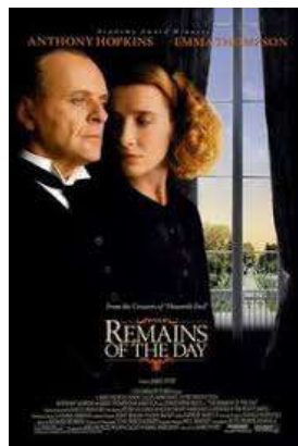
The Remains of the Day (Resten af Dagen) Filmplakat

Med sit blik for karakterskildring og brug af synsvinkler skaber Ishiguro således nogle hjerteskrærende fortællinger, hvor patosen dog aldrig kammer over.