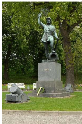
Landsoldaten, H.W. Bissen