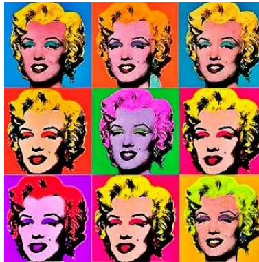
Marilyn Monroe (Andy Warhol)

Denne dag kigger vi nogle af kunsthistoriens mesterværker efter i sømmene og ser nærmere på en række af de værker, der gennem historien har været med til at trække kunsten i nye retninger. Hvordan kan et urinal, kantede og forvrængede kroppe, vilde drypmalerier og Marilyn Monroes portræt i massevis være betydningsfulde for kunstens udvikling? Og hvilke nyere værker kandiderer til titlen som mesterværk?