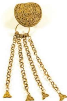
Pragtspænde fra Fæsted

I dette foredrag fortæller museumsleder Bo Ejstrud historien om fundet, dets baggrund, og ikke mindst om at gøre sit livs fund.