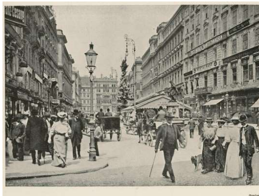
Wien, Graben, 1900

Kejseren Franz Joseph regerede over det hele: Fra Adriaterhavet til Ukraine – fra Prag til Sarajevo. Hans eneste søn begik selvmord i Mayerling og den underskønne og meget eksentriske kejserinde, Elisabeth, blev myrdet.