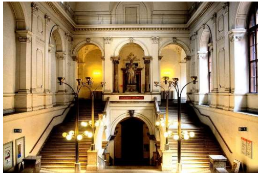
Wien Universitet, Juristenstiege.

Foredraget tager på en rundrejse i Wiens videnskab med eksempler på nogle af de store videnskabsfolk og historier om deres færden i Wien.