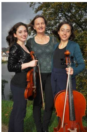
Corde di Gioia

Corde di Gioia fortæller om tidsperioden og introducerer musikken og digtene med særlig fokus på tidens sans for humor.