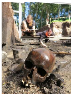
Alken Enge, udgravningen