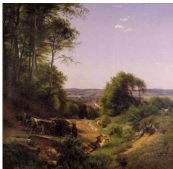
P.C. Skovgaard, Udsigt over Vejle, 1852

Michael Kvium's lærreder med deformede mennesker træder os i møde. Kvium har sagt: "Jeg lader mig styre af fascinationen og altid af ekstremer." Konklusion: Vejle Kunstmuseum er et væsentligt museum.