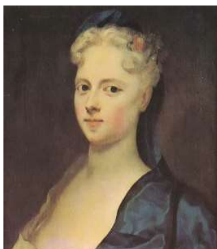
Anna Sophie Rewentlow

Anna Sophie tænker i fortællingen tilbage på sit liv: På barndommen og den strenge opdragelse hos sin religiøse mor og en livskraftig, men fraværende far. Hun tænker ikke mindst tilbage på sin store kærlighed til kongen og på deres mange børn, der alle døde og bragte parret stor sorg.