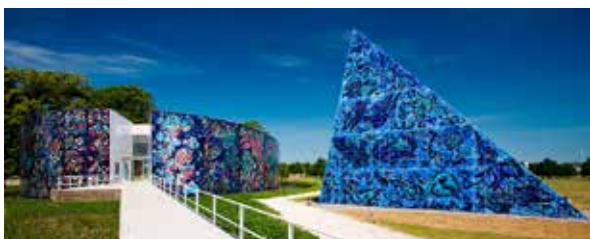
Carl-Henning Pedersen og Else Alfelts Museum

Den anden kulturhistoriske forelæsning vil dreje sig om J.C. Christensen (1856-1930), bøndernes markante talsmand omkring 1900 og op gennem de første 25 år af 1900-tallet. Han var konseilspræsident (statsminister) fra 1905-1908. Endelig behandles der sider af Kaj Munks digtning og nationale indsats, især under besættelsen. Forelæsningen vil også sætte især den politiske del af disse to personers virke i gensidig relief.