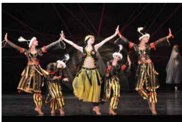
Polovetserdansen fra operaen Fyrst Igor af Alexander Borodin

Som en del af forløbet lægges der op til en koncert med Aarhus Symfoniorkester.