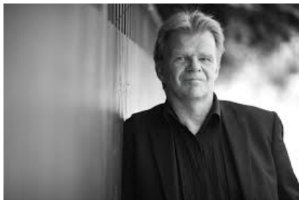
Einar Már Guðmundsson

Forslag til læsning på forhånd: "Universets engle" og "Hundedage".